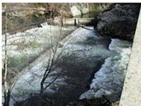
麦基艾培盖特大桥 俄勒冈州 McKee Applegate River Bridge in Oregon